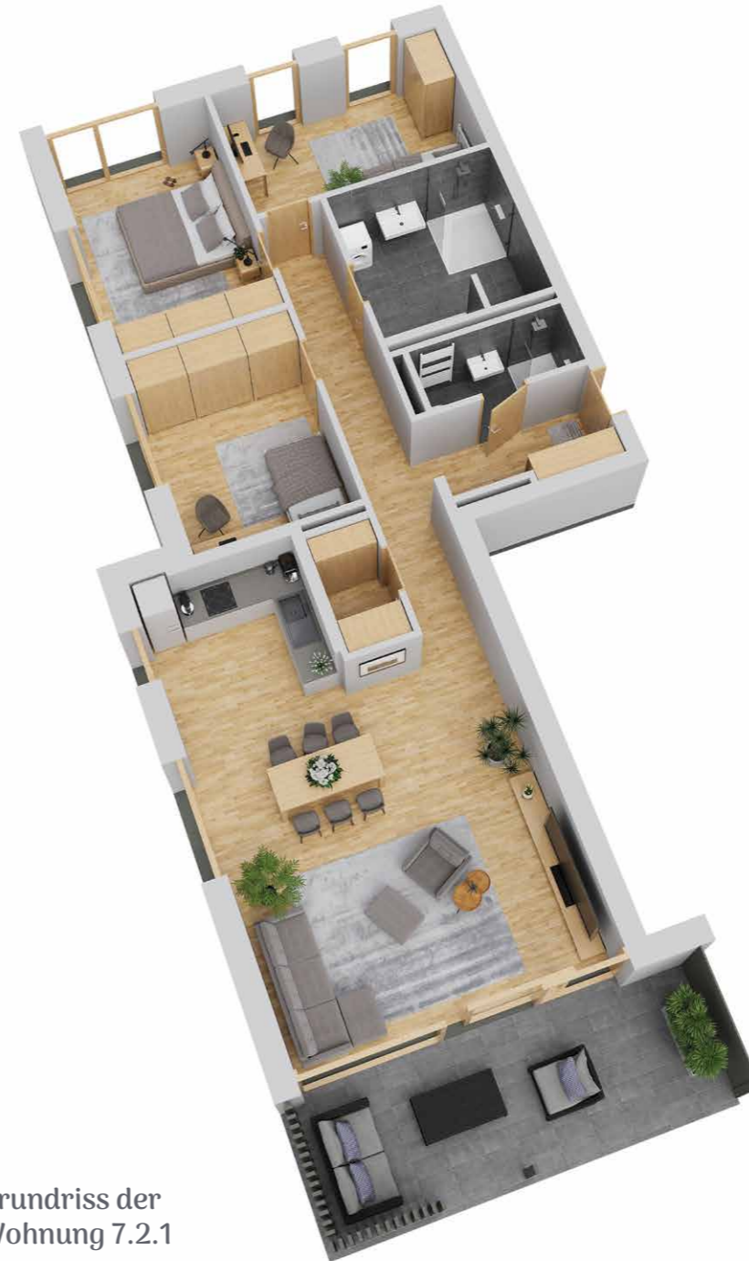
Grundriss der Wohnung 7.2.1